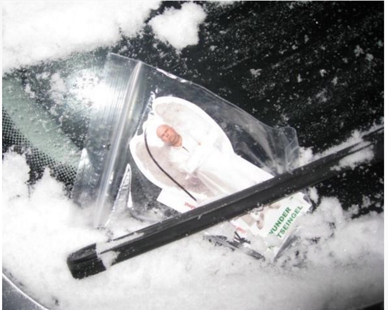
Kampaania teisel kuul tuletas kaitseingel end meelde guerillaaktsiooniga autode kojameeste vahel.