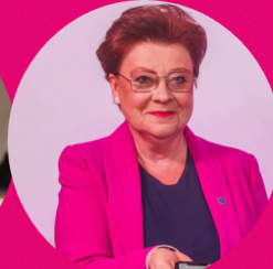
✓ Sirje Karis Museoloog, Eesti Vabariigi presidendi abikaasa