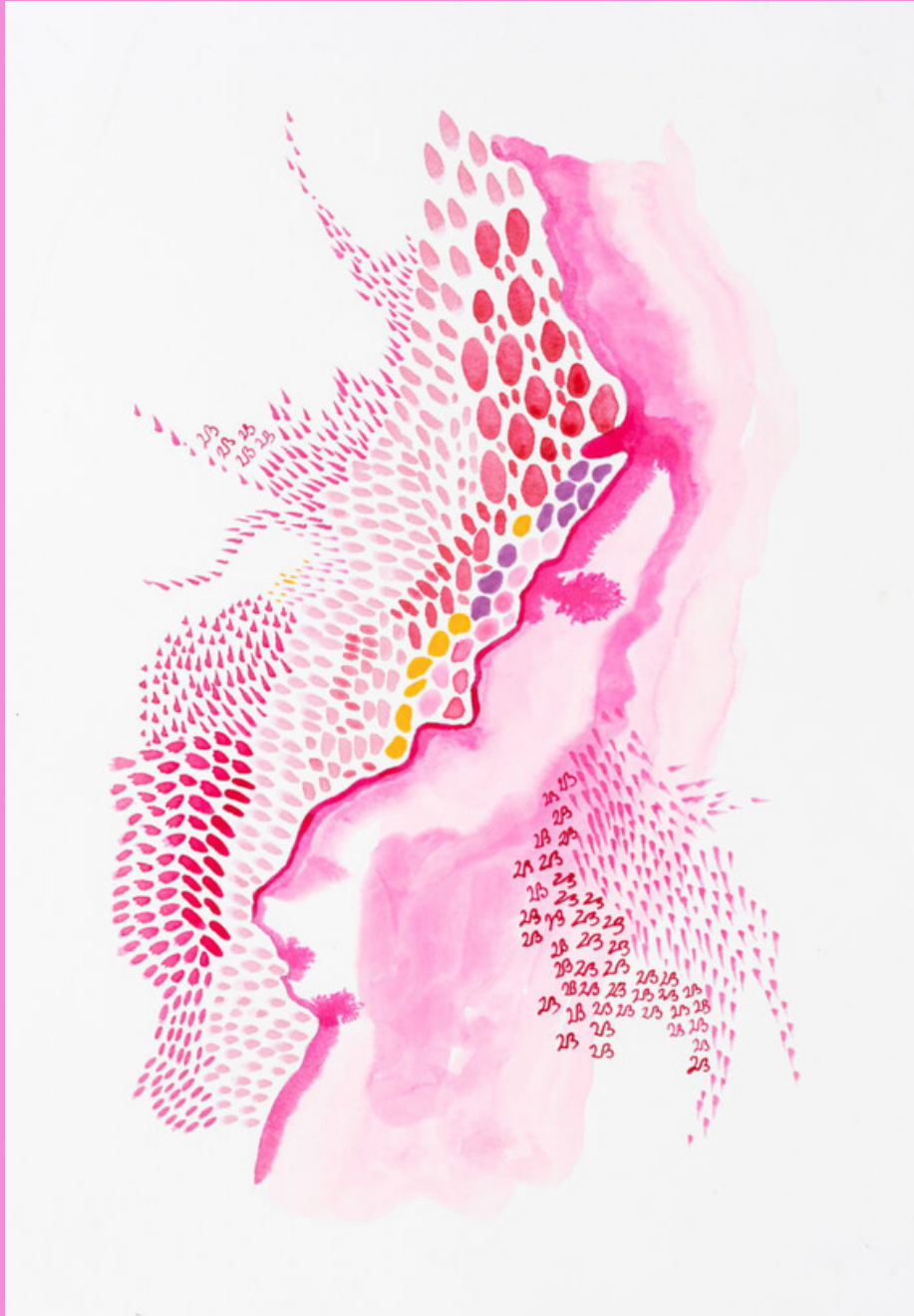
Nr 23 on pintsli tõmmetena all paremal mustris.