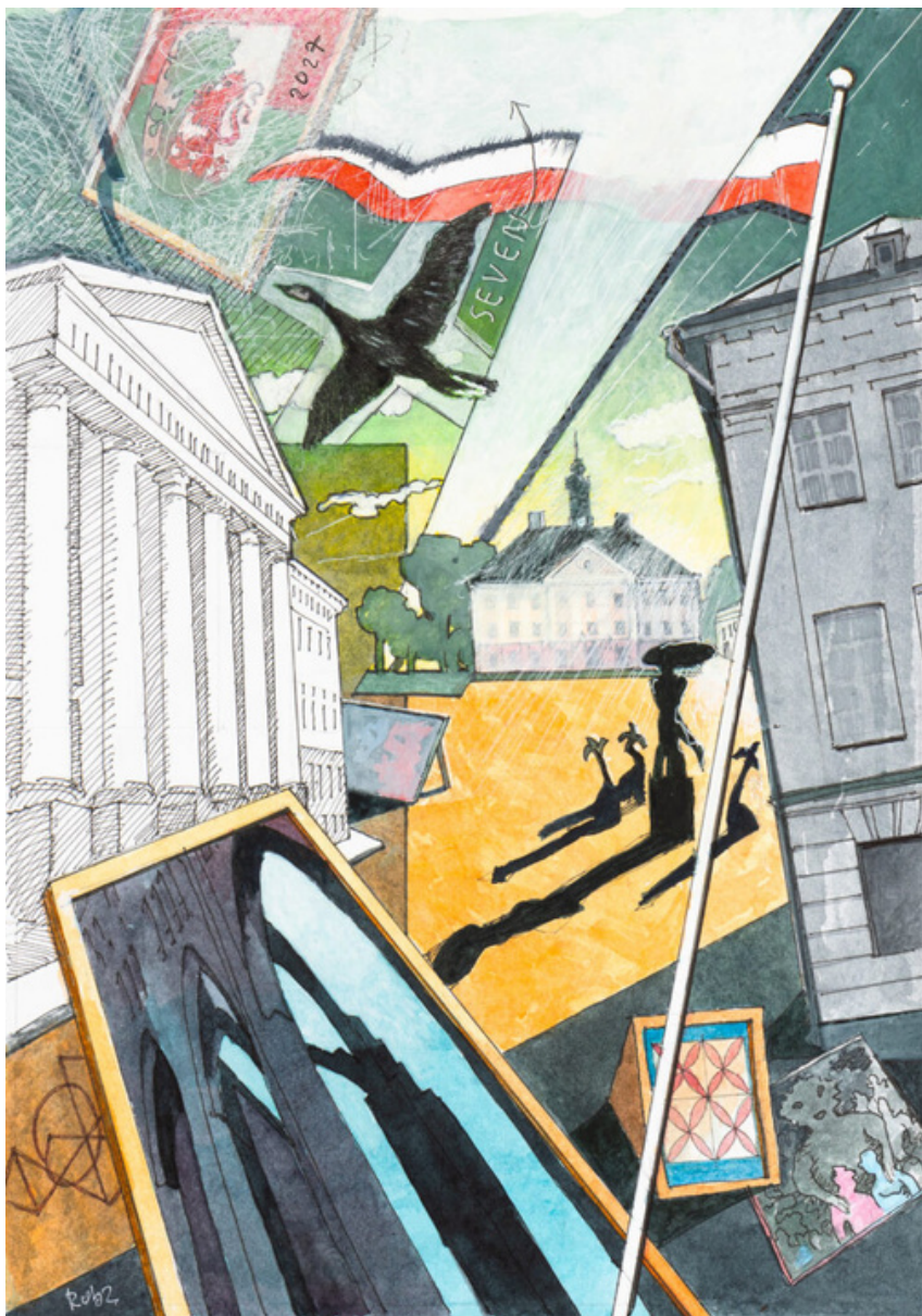
ULDIS RUBEZIS "Shifting Focus" (7)