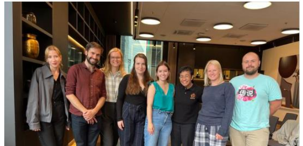
Kuvatõmmis Eesti Noorte Ajakirjanike Seltsi sotsiaalmeediapostitusest. Kohtumisel osalesid noored ajakirjanikud ERRist, eesti- ja venekeelsest Postimehest, Delfist ja Äripäevast