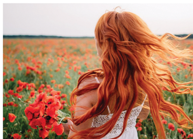
Korterit üürile andmisel ei tohi diskrimineerida, ei vasakukäelisi ega punapäid, ega ka muudeomaduste alusel.

Toimetas: Kadri Sildmets katri.sildmets@arileht.ee