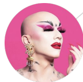
@sashavelour 1.7M followers

✓ Rahvusvahelise brändituntuse saavutamine