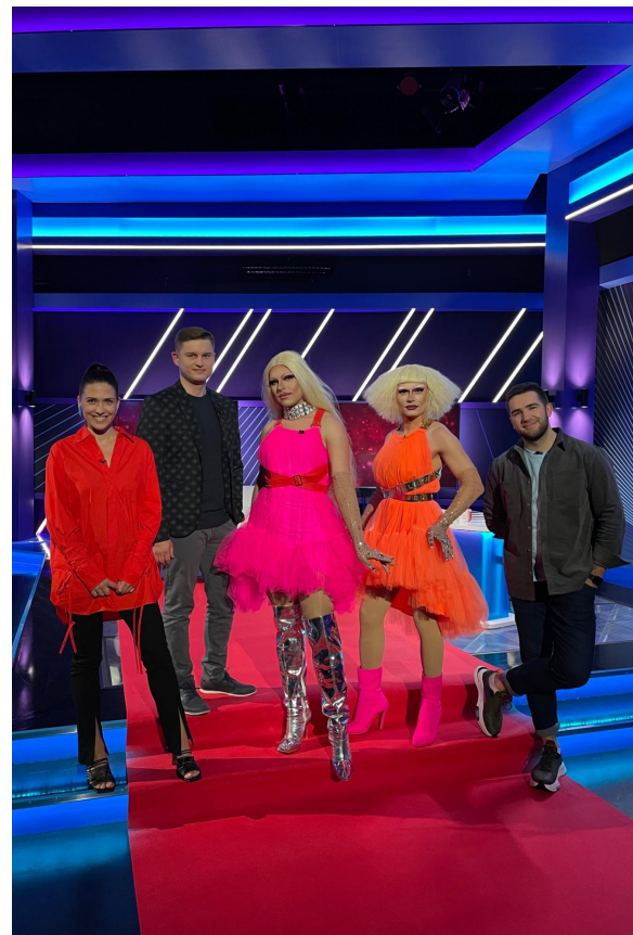
Kanal 2 "Õhtu!" live-esinemine (märts 2022)