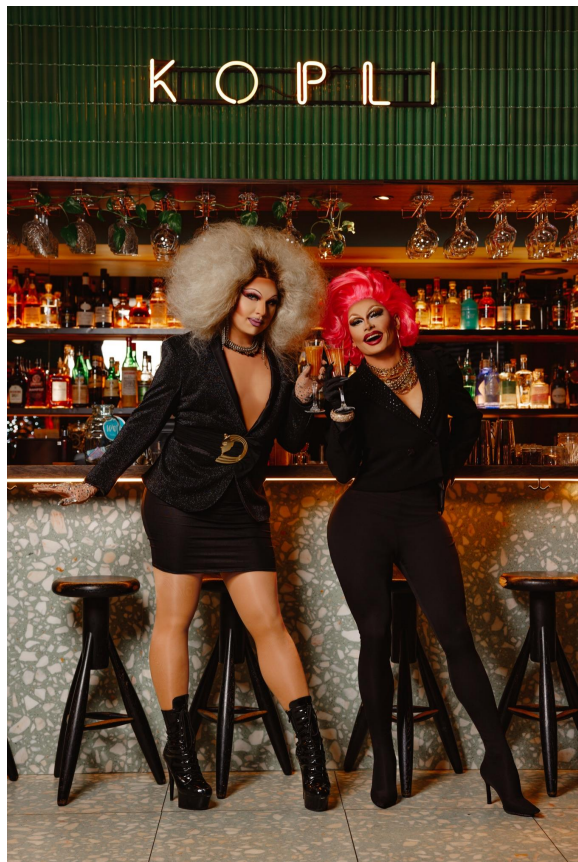
"Drag Brunch" ürituste sarja promomaterjalid (talv 2022)