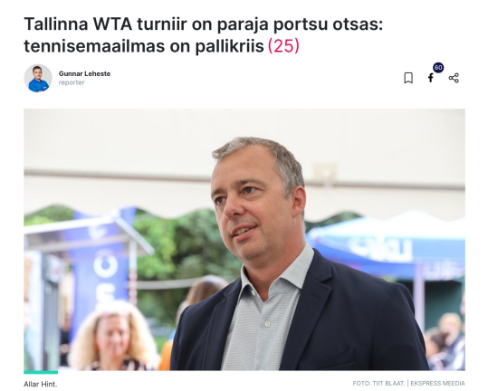
Tallinna WTA turniir on paraja portsu otsas: tennisemaailmas on pallikriis (25). Allar Hint.