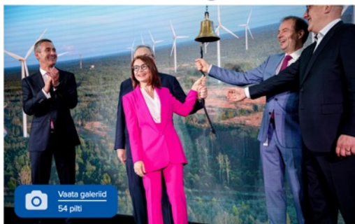
Foto: Tallinna börsil alustas kauplemist Enefit Greeni aktsia.