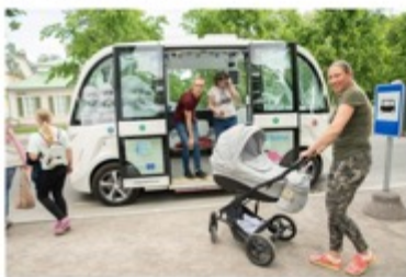
People use a self-driving bus being tested out on tourist routes in Tallinn, Estonia.

Agence France Presse | 12:18 PM June 20, 2020