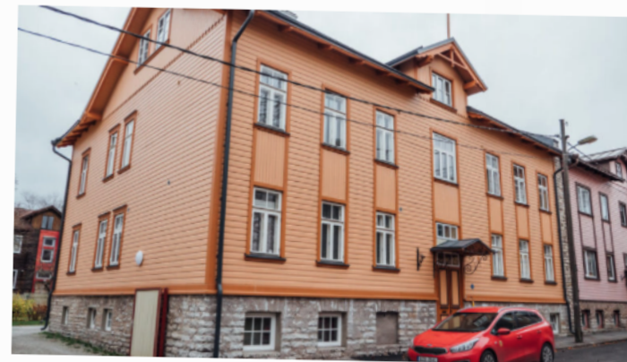
Korter Kalamajas.