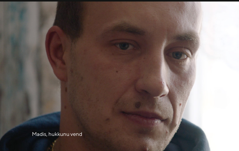
Madis, hukkunu vend