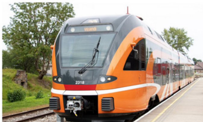
Raudteehotust saavad tagada vaid kõik liikluses osalejad üheskoos.

Kuigi traagiliste õnnetusjuhtumite arv Eesti raudteedel on tänavu vähenenud, on tunduvalt kasvanud potentsiaalselt ohtlike olukordade arv. Napilt pääsejad on üha sagedamini lapsed.