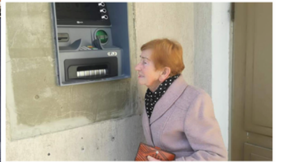
Pangaautomaat Rõpinas. Pilt on illustratiivne.

PM VALIMISED 2019 ARVAMUS MEIE EESTI MAJANDUS MAAILM F Juhtimine | Äri | Börs | Välis | Auto | Tööstus ja tootmine | Merendus | Tehnil Majandus - Graafik: sularahaautomaatide arv on kümne aastaga vähenenud 200 võrra