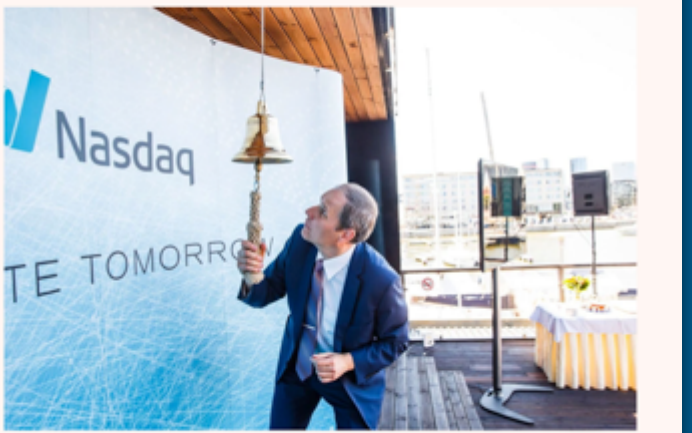
Juba ette rahvaaktsiaks kutsutud Tallinna Sadama aktsia tegi