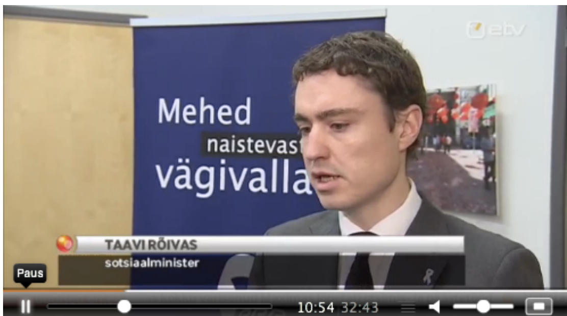
Sotsiaalminister andmas intervjuud 25.11 Aktuaalse Kaamera uudistele.