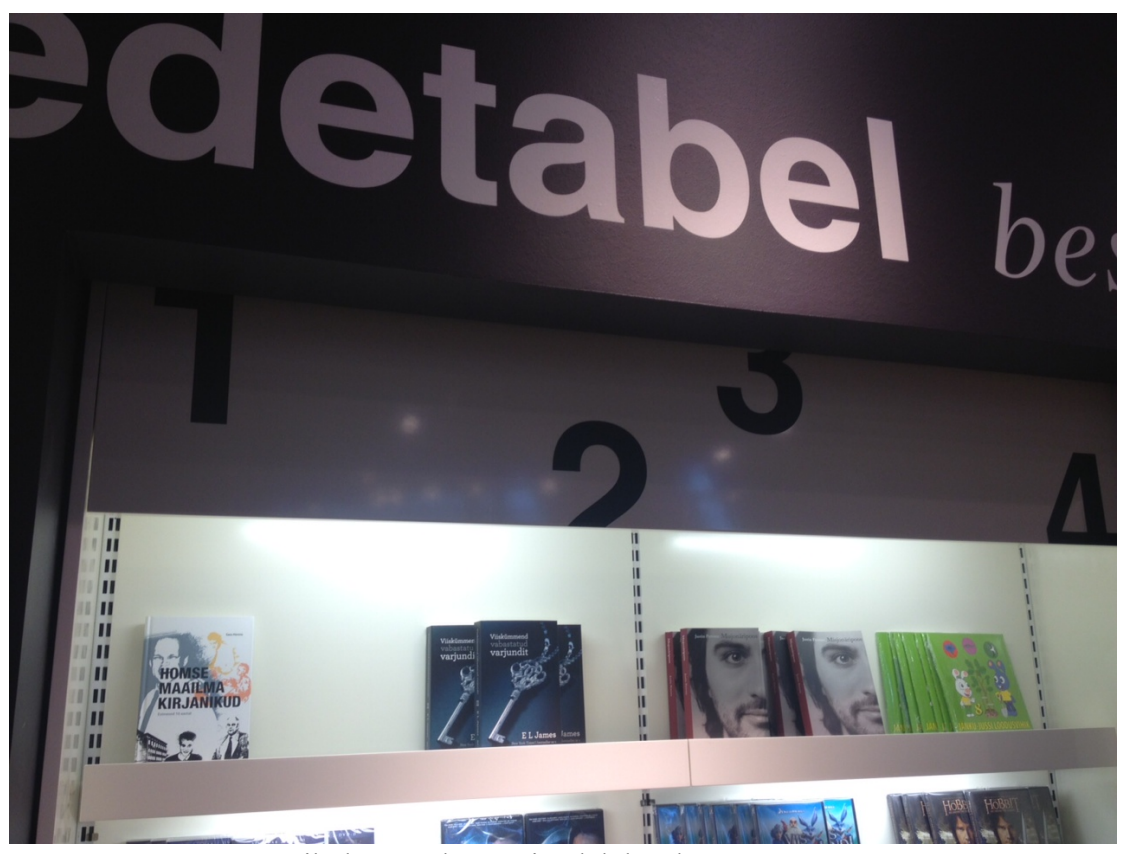
Esikoht teasel müüginädalal Rahva Raamatus

Homse maailma kirjanikud on tänase Eesti kõige pikem copytekst, mille kirjutamiseks kulus veidi rohkem kui 6 kuud.